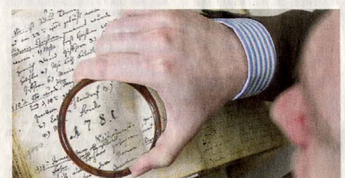
Alte Kirchenbücher sind wahre Fundgruben für Ahnenforscher.

Die Deutschen haben ein neues Hobby für sich entdeckt: die Ahnenforschung. Die Familienerforschung hat ihr „staubiges“ Image schon längst verloren.